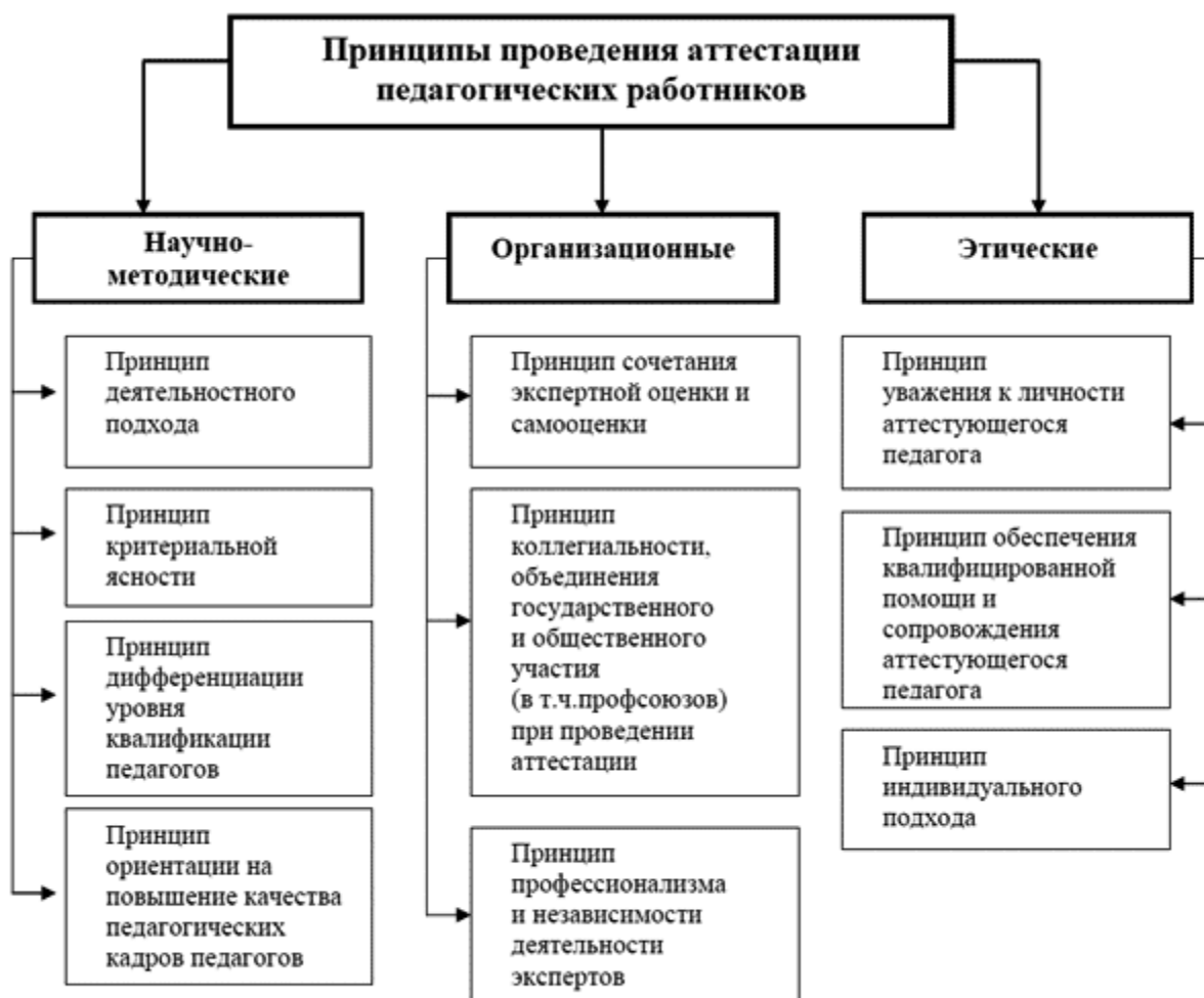
Рис. 1. Принципы проведения аттестации педагогических работников